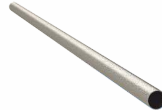
Bağlantı Borusu Steel Tube