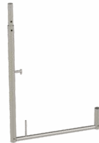
PS L Korkuluk Çerçeve PS L Frame