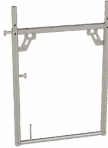
PS H Çerçeve PS H Frame