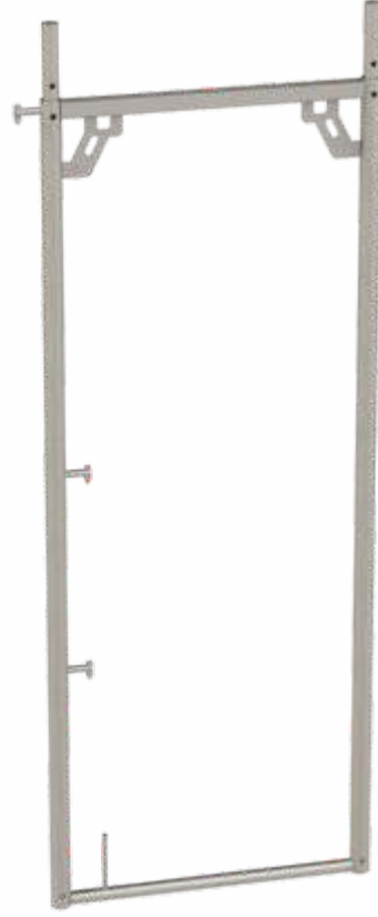
PS H Çerçeve PS H Frame