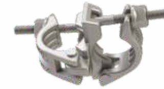
Sabit Kelepçe Fixed Coupler