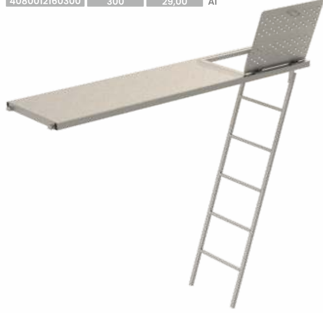
Sac Yüzeyle Sheet Surface