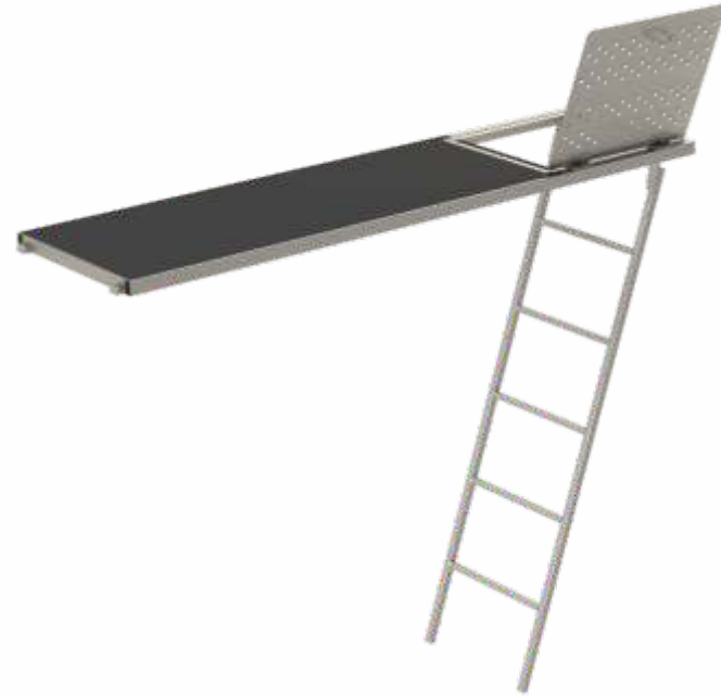
Plywood Yüzeyle Plywood Surface