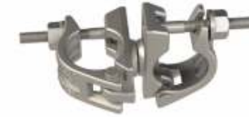
Hareketli Kelepçe Swivel Coupler