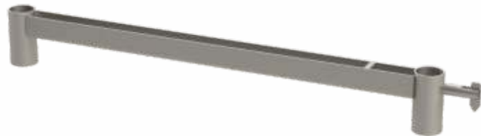
Başlangıç Ayağı Starter Base